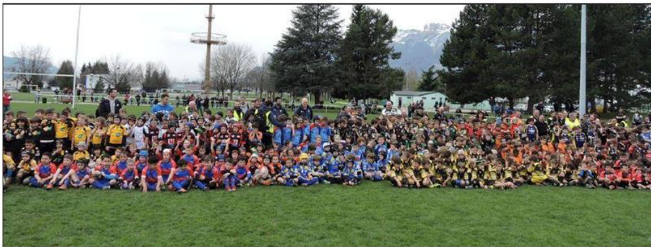
Plus de 700 enfants de 6 à 10 ans ont participé au tournoi interdépartemental des écoles de rugby.