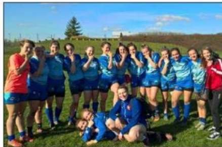
L'équipe féminine UNSS du lycée Monge à Dijon.