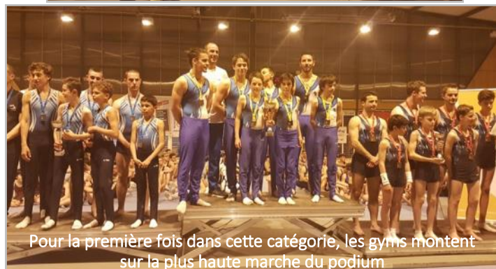
Pour la première fois dans cette catégorie, les gyms montent sur la plus haute marche du podium