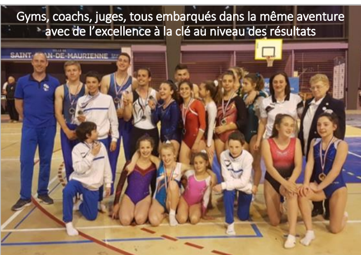
Gyms, coachs, juges, tous embarqués dans la même aventure avec de l'excellence à la clé au niveau des résultats

Samedi 28 avril se déroulait au gymnase Pierre Rey à Saint Jean de Maurienne, le Championnat Régional Individuel Mixte (catégories I et II), organisé par les Bleuets, sous l'égide de la Fédération Sportive et Culturelle de France (FSCF).