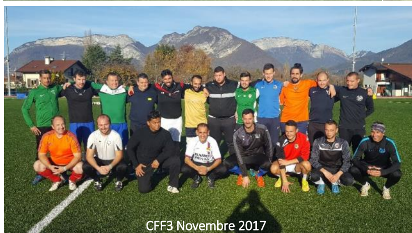
CFF3 Novembre 2017