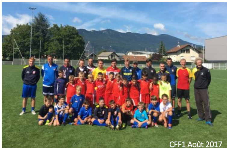
CFF1 Août 2017