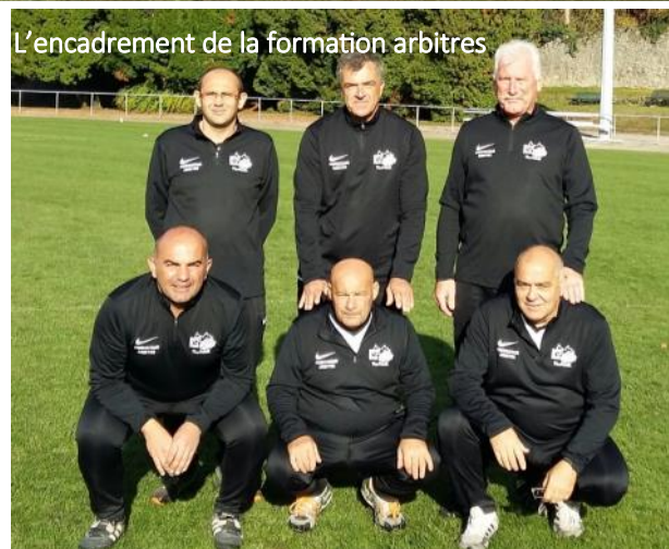
L'encadrement de la formation arbitres