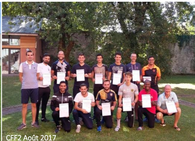
CFF2 Août 2017