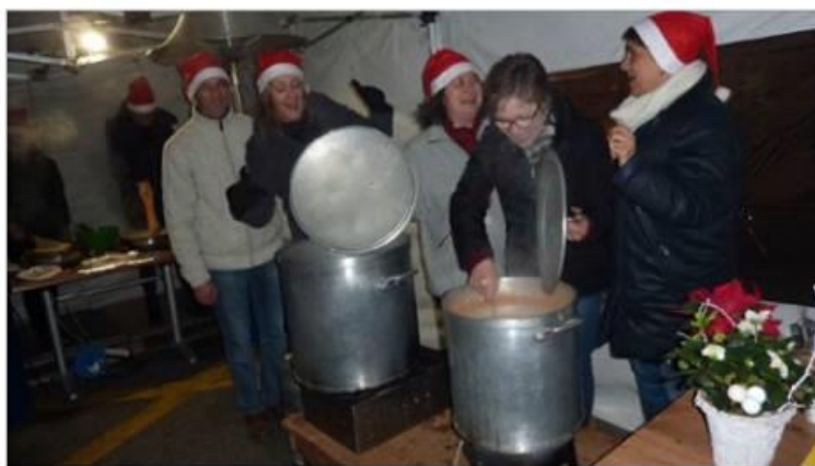
Les bénévoles, souvent du club des Gentianes, servent la soupe, font les crêpes et discutent avec ceux qui viennent rue du Commandant Perceval. Sous la tente éphémère, l'ambiance est chaleureuse.