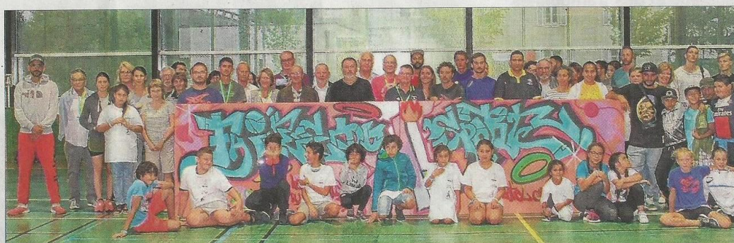
La photo avec l'ensemble des organismes participants, clubs et partenaires.

En fin d'après-midi, la fresque réalisée par les enfants a été présentée au public, aux élus et aux représentants du préfet et du conseil départemental.