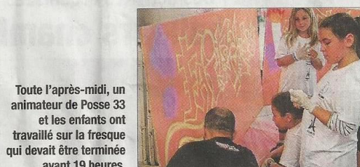
Toute l'après-midi, un animateur de Posse 33 et les enfants ont travaillé sur la fresque qui devait être terminée avant 19 heures.