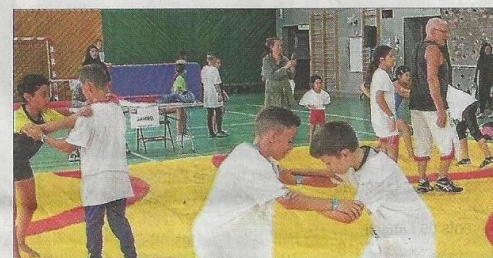
Le plateau où la lutte et le sambo présentaient leurs activités.