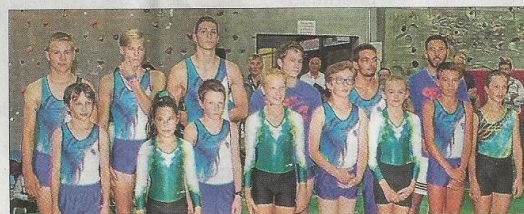
Les gymnastes de l'Alerte-Gentianes, après leur démonstration, qui a impressionné les spectateurs.