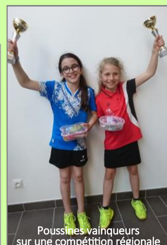
Poussines vainqueurs sur une compétition régionale