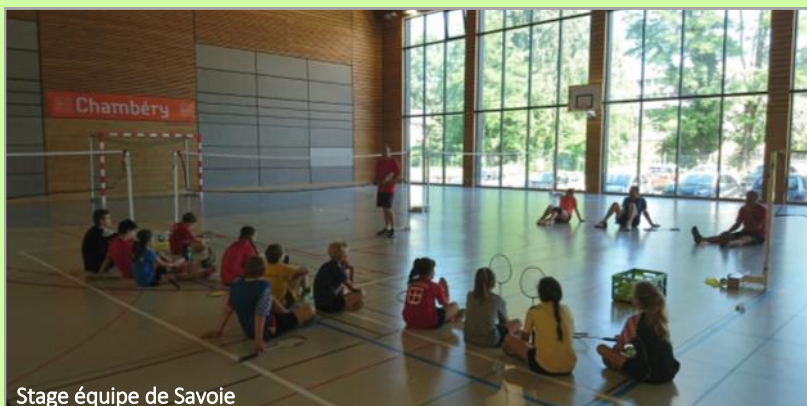
Stage équipe de Savoie