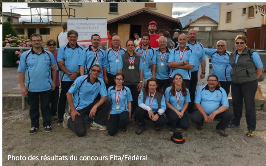
Photo des résultats du concours Fita/Fédéral