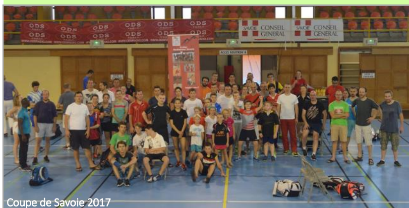
Coupe de Savoie 2017