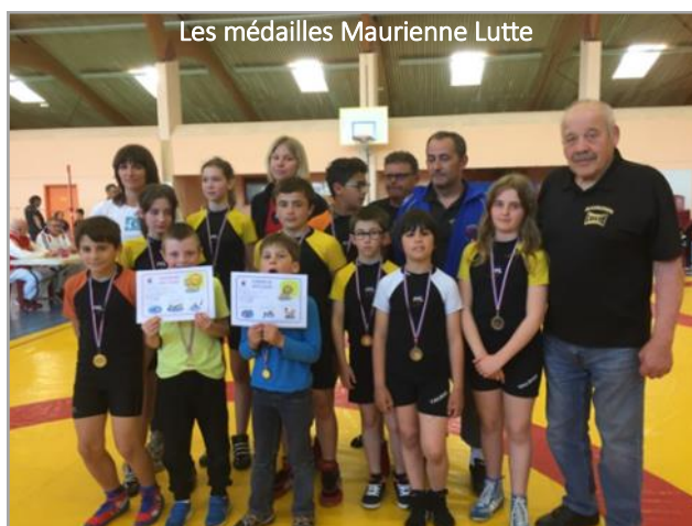
Les médailles Maurienne Lutte