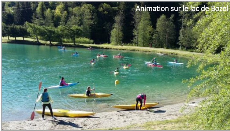
Animation sur le lac de Bozel