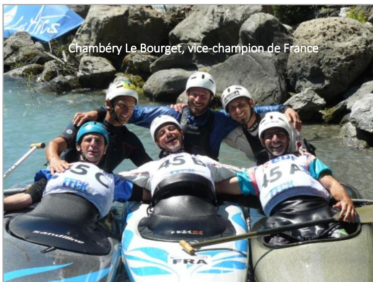
Chambéry Le Bourget, vice-champion de France

Après les premiers jours hésitants qui ont retardé les entraînements, les compétitions ont bien eu lieu et deux médailles dont un titre de champion olympique en canoë monoplace sont venues garnir le tableau des médailles françaises.