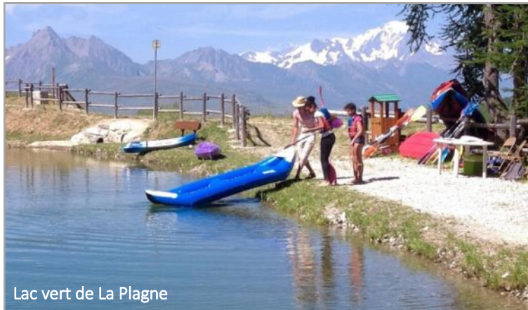
Lac vert de La Plagne

La course des canoës biplaces a vu 4 équipages handi-valide se former, avec un équipier de chaque club savoyard accompagnant un jeune de l'Elan Chambérien. Bravo la mixité !