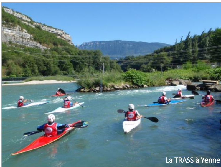
La TRASS à Yenne

Pour les championnats de France descente, seul le club de La Plagne a fait le déplacement jusqu'à Barcelonnette.