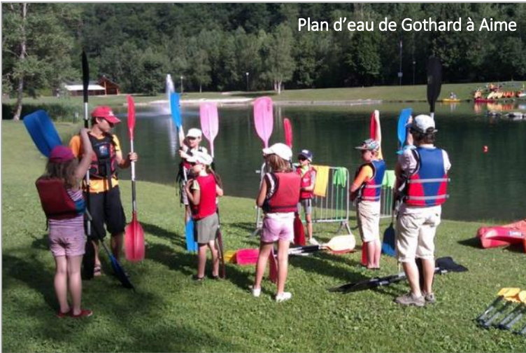
Plan d'eau de Gothard à Aime

Le beau temps de cet été a permis à des centaines de vacanciers de s'initier au canoë-kayak. Ils ont pu naviguer sur le plan d'eau de Bozel, celui de Gothard (Aime) ou de Bourg Saint Maurice, ainsi qu'au lac vert de La Plagne ou sur le lac du Bourget. Les clubs de Tarentaise proposaient aussi raft, canoë gonflable ou stand up paddle. Le lac du Praz à Courchevel est depuis cette année interdit au kayak et aucune animation n'a pu s'y dérouler.