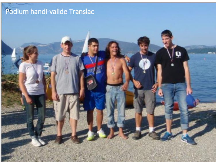
Podium handi-valide Translac