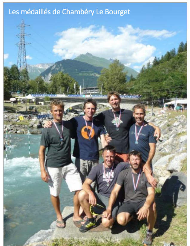
Les médaillés de Chambéry Le Bourget