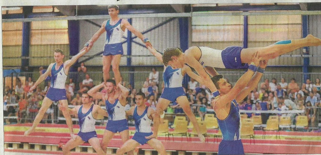
L'équipe des aînés de l'Alerte pendant la production fédérale termine 1 re en régionale 1.

5 clubs représentaient la Savoie : l'Alerte-Gentianes (Chambéry), l'Étoile motteraine (La Motte-Servolex), les Gyms (Saint-Alban-Laysse), la Galopp' (Bassons) et les Bleus de Maurienne