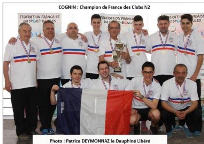
COGNIN : Champion de France des Clubs N2

Le dernier en date, au mois d'avril le club de Cognin a été sacré champion de France des clubs sportifs en Nationale 2 ce qui lui permettra d'évoluer en Nationale 1 la prochaine saison sportive.